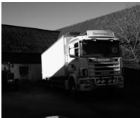
Lastbilen hämtar de sista mjölkorna på Thureshild.

- Priserna kommer att stiga, det är jag säker på. I och med att det är så dyrt i Malmö- och Lundområdet börjar folk se sig om längre ut.