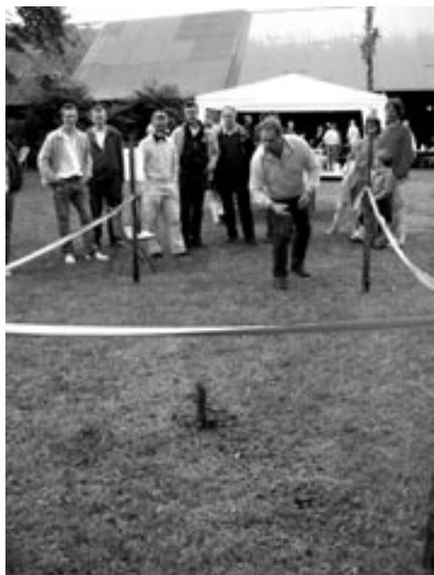
Thord i hästskoaction. Det ser ut att räcka till final.

Apropå hästkokastningen bidrog den nog starkt till att midsommarfesten gick med vinst, trots att det inte var väntat. Somliga styrelseledamöter sågs lägga stora summor på att försöka få skorna att hamna runt pinnen, dock utan framgång. I minst en trädgård i byn, invid ett grönt hus kanske, kommer det nog att övas flitigt på denna konst nästa vår och försommar.